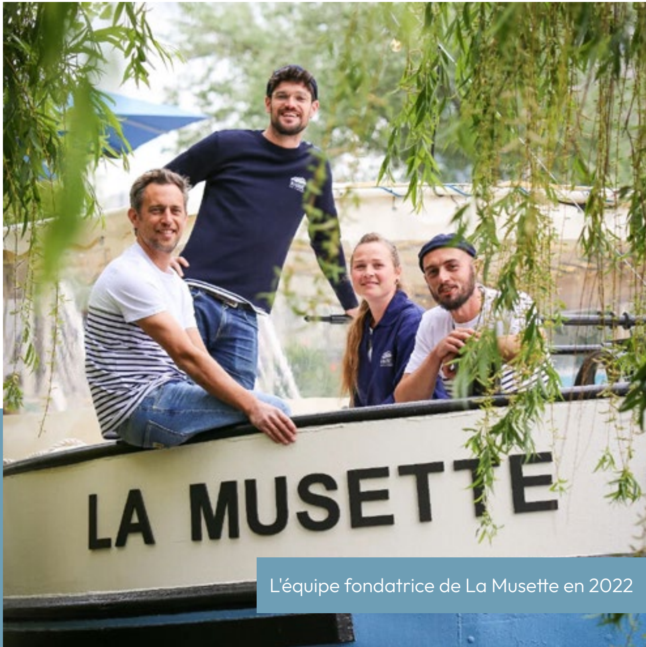
L'équipe fondatrice de La Musette en 2022