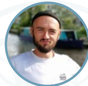
JB Capitaine Opérationnel

Un accueil sans chichis, toujours dans la bonne humeur !